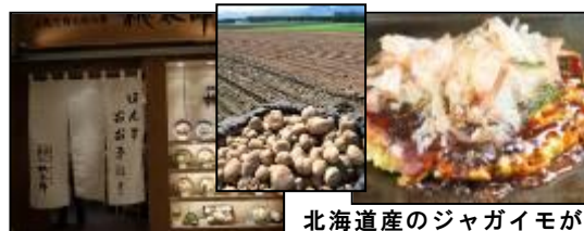
北海道産のジャガイモがお好み焼きの名店 桃太郎 丸ごと入ったお好み焼き