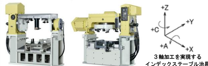
ワンチャックで複数の加工を可能とするインデックステーブル

生産現場において少ないスペースで如何に効率の良い生産を実現するかは大きな課題です。同時5軸加工機は工作機械の中でも高額なマシンになり、簡単に設備投資を行うことができません。そのため、複雑な加工を必要とする製品には長いステーションを取る必要がありました。そんな課題を解決とする手段がインデックステーブル治具です。インデックステーブル治具を活用すれば、3軸加工機でも5軸加工機と同じようにワンチャックで複数の加工を実現できます。それにより、1台の加工機で多品種微量の生産に対応することができ大幅なコストダウンを実現できます。