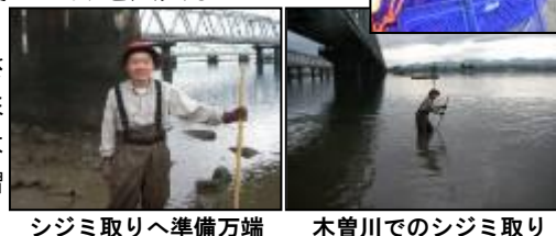
シジミ取りへ準備万端 木曾川でのシジミ取り