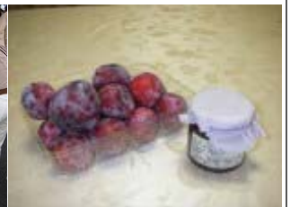
橋本スモモ(左)とスモモジャム(右)高山地方独自の甘いスモモです

「治具技術ニュース」は東亜精機工業(株)の弊社とお取引のある会社や弊社営業担当と過去に担当者様・名刺交換された方へ郵送・送信しています。不用の方はお手数ですが下記にご記入の上、【FAX】06-6976-6960 までご返信下さい。ご迷惑おかけして申し訳ありません。理由: 不用 本人不在 その他( ) FAX 番号( )