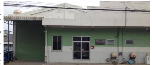
これが東亜精機工業のタイ工場です

研修を通じて、たくさんの部品製作・組図の見方、治具の組み付け方などを学ぶことができたのと同時に、自分たちも経験を積み、もつと技術を習得すべきであると強く感じました。また、仕事以外の面においても、日本で生活することにおいては、タイ国に比較し沢山のルールがあるのに驚きました。今後は日経企業の一員として文化を吸収すると同時に、日本本社での技術トレーニング研修で学んだ知識・技術を最大限に活かして、高精度・高品質なものづくりでいち早く皆様のお役に立てるよう頑張っ参ります。今後とも東亜精機工業をどうぞ宜しくお願い致します。