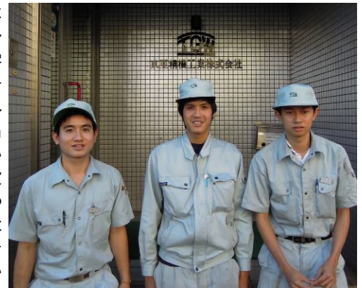
ガン ポート バン