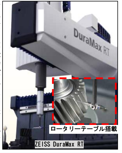
ロータリーテーブル搭載

東亜精機工業では、製作する全ての治具に対して、厳しい品質管理体制下で、品質検査を行っています。この度、小物部品の精密検査用として、東京精密製の最新の小型三次元測定機「カールツァイスシリーズ DuraMax RT」を導入しました。従来の大型三次元測定機2台と併用して、最新の測定技術を駆使し、精度向上と納期の短縮に努めます。当社はお客様のお役に立てる企業を目指し、信頼性の高い治具を提供いたします。