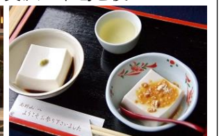
ワサビ醤油とデザート風 (和三盆添え)

「治具技術ニュース」は東亜精機工業㈱の弊社とお取引のある会社や弊社営業担当と過去に担当者様・名刺交換された方へ郵送・送信しています。不用の方はお手数ですが下記にご記入の上、【FAX】06-6976-6960までご返信下さい。ご迷惑おかけして申し訳ありません。