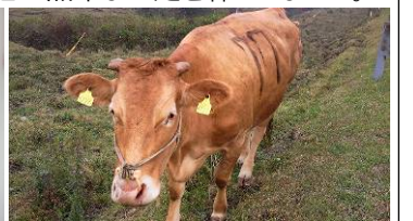
これが南阿蘇のあか牛。放牧されて育つあか牛は、程よい脂肪のバランスが特長です

「治具技術ニュース」は東亜精機工業㈱の弊社とお取引のある会社や弊社営業担当と過去に担当者様・名刺交換された方へ郵送・送信しています。不用の方はお手数ですが下記にご記入の上、【FAX】06-6976-6960 までご返信下さい。ご迷惑おかけして申し訳ありません。