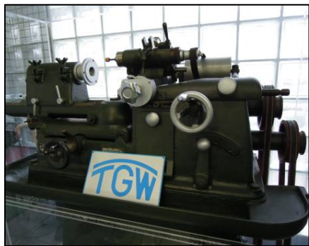
当社で製作していた内面研削盤。これをベースに外径内面兼用研削盤を開発中！

東亜精機工業の新たな取組みについてご紹介致します。弊社は平成24年度ものづくり試作開発等支援補助金の採択を受け、「小型の外径内面兼用研削盤製作事業」を行っております。下記の写真のように、かつて東亜精機工業はメーカーとして内面研削盤を製作していたこともあるのです。この創業時のメーカースピリットを想い出して、内面研削の機能に外径研削の機能を付加した研削盤を製作致します。製作にあたっては、弊社自身が内面・外径研削盤のユーザーであること、およびお客様に製品を提供しているという双方の立場を生かして、精度や使い勝手を検証しながら皆様に役立つ製品に仕上げ参ります。なお、この外径内面兼用研削盤はJIMTOF2014に参考出品予定！ご期待下さい！