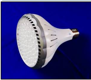
省エネに加え交換も不要です

東亜精機工業では工場内の水銀灯をLED照明に切り替えることで、微力ながら省エネに貢献しています。LED照明は消費電力が低減することに加え、水銀灯よりも寿命が長く、さらに有害な水銀も含まれない事から環境にもやさしいものです。こういった小さな事を積み重ねて、地域・社会に貢献してはならない東亜精機工業を目指します。