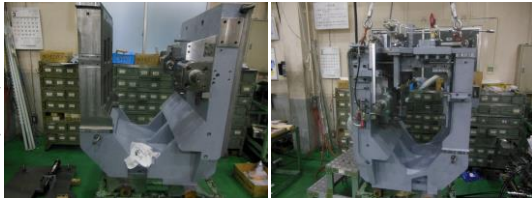
製作途中の大型治具

今回は、当社が最近製作した専用機用の加工治具についてご紹介をします。こちらは全長で2mを超える大型治具で、当社でもこのサイズは珍しい製作事例となります。用途としては、自動車のシリンダブロックの生産ラインで使用するもので、某自動車メーカー様の北米工場向けの製品です。今回の事例のように当社では2m超の大型治具の製作も承っており、自社トラックやチャーター便を使って納品も対応可能です。専用機治具の設計・製作でお困りの際は東亜精機工業にお任せください。