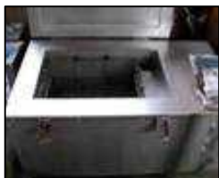
マイナス72度以下で冷却するサブゼロ処理

「テンパー処理」とは、低温での焼き戻し処理のことをいいます。テンパー処理の目的は、冷間で熱処理をすることで加工部分にある残留応力を取り除くことです。残留応力があると経年とともに変形の発生の要因となり、品質低下につながります。冷間で熱処理すると、熱処理による加工硬化をおこなっている材料自体の機械的性質の改善をすることができるのです。低温の焼き戻しをすることによって、加工品の弾性限と耐力の向上を実現できるのです。