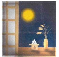
やっぱり満月にはお団子が似合います

でもやっぱりお月見は『お団子』ですよ♪ それでは今月もお伝えて参ります！ 編集長 文山