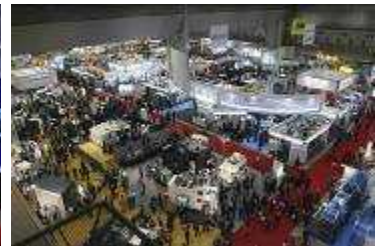
世界中から600社近くの工作機械・工作機械周辺機器メーカーが最新鋭の商品を出展