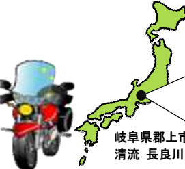
岐阜県郡上市 清流 長良川