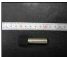
サブゼロ処理とテンパー処理を施したピン