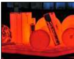
低温焼き戻しにより残留応力を取り除くテンパー処理