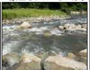
日本を代表する清流の長良川

「治具技術ニュース」は東亜精機工業㈱の弊社とお取引のある会社や弊社営業担当と過去に担当者様・名刺交換された方へ郵送・送信しています。不用の方はお手数ですが下記にご記入の上、【FAX】06-6976-6960 までご返信下さい。ご迷惑おかけして申し訳ありません。