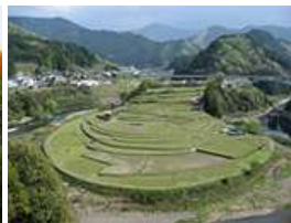
近くには日本棚田100選にもなよい香りが口の中に広がります。った「あらぎ島」があります。

「治具技術ニュース」は東亜精機工業(株)の弊社とお取引のある会社や弊社営業担当と過去に担当者様・名刺交換された方へ郵送・送信しています。不用の方はお手数ですが下記にご記入の上、【FAX】06-6976-6960までご返信下さい。ご迷惑おかけして申し訳ありません。