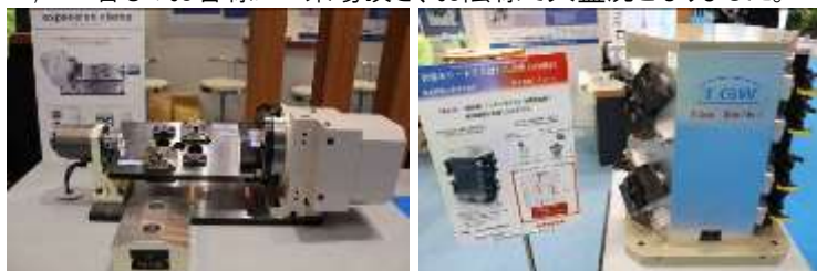
ブースではご来場頂いたお客様に目で肌で感じてもらうために、上記のように各種の大型の治具を実際に展示致しました。

東亜精機工業は昨年11月1日(木)～11月6日(火)に東京ビッグサイトで開催されたアジア最大級の工作機械見本市「JIMTOF2012」に今回初めて出展しました。今回のJIMTOFは23の国・地域から815社・団体(うち海外から237社・団体)が参加し、会期中の来場者数は128,674人(うち海外は8,347名)となり、前回は上回る結果となりました。なお、東亜精機工業のブースにはのべ1,000名ものお客様にご来場頂き、お陰様で大盛況となりました。